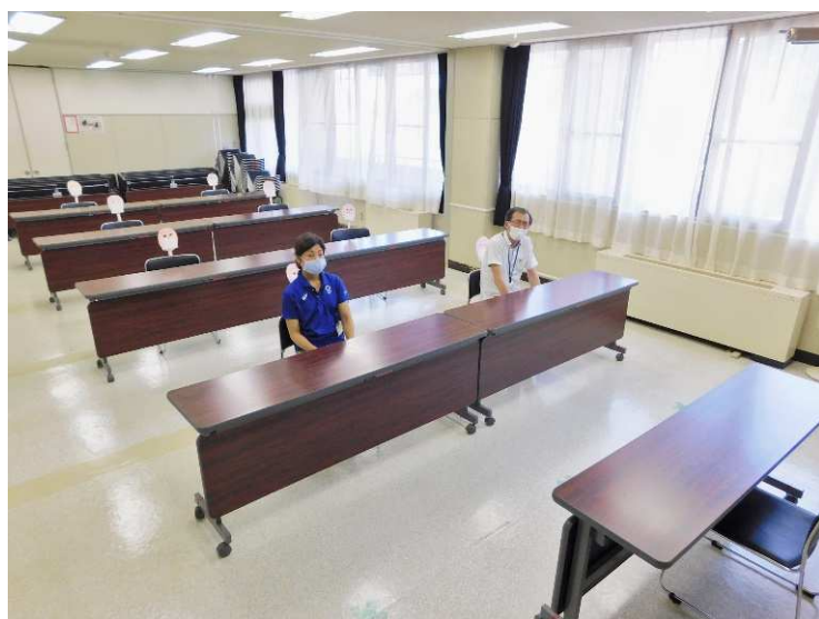
↑ 2階 第1・2学習室(座席9名分)

机・椅子を使用する想定で、前後左右ともに「1.5m」の間隔で配置するとこのようになりました。