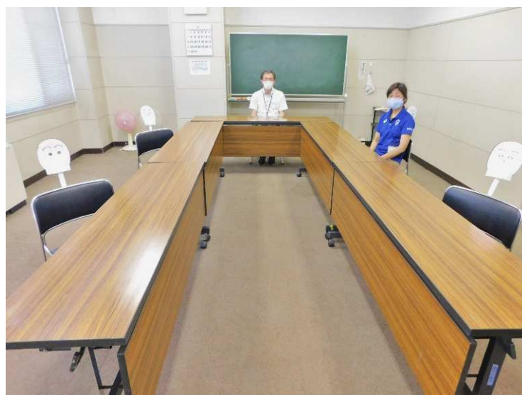
↑ 2階 会議室(座席5名分)

2階で一番広い部屋・狭い部屋を例にしてみました。机を省略すればもう少し座席数を増やせそうですが、適切な間隔を空けて着席した場合、上の表の定員数をすべて収容することは、かなり厳しいと感じました。利用者の皆さんには大変ご不便をおかけしますが、通常より広い部屋を予約する・人数を少なくして活動する等、適切な部屋利用へのご協力をお願いします。